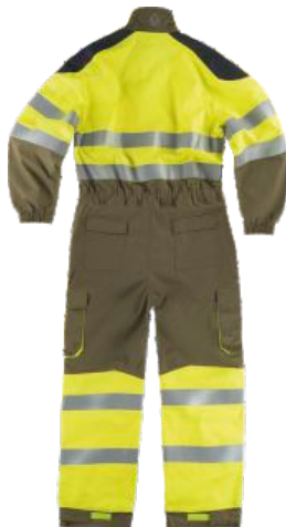
kaki/amarillo a.v./gris oscuro