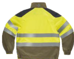
amarillo a.v./kaki/gris oscuro