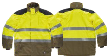
kaki/amarillo a.v./gris oscuro

Tejido: 75% Algodón 24% Poliéster 1% Fibra antiestática (270 g/m2)